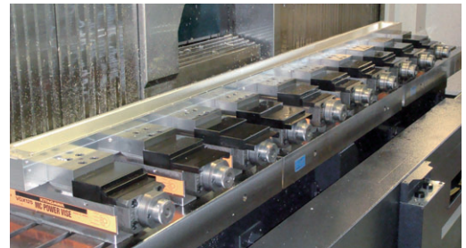
▲3mリアテーブルのM/Cにバイス10台を並列仕様で搭載 ▲On the 3 m linear table, 10 vises are mounted with the parallel specification.