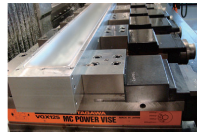
▲長尺物の精密機器部品を加工 ▲Long-size precision equipment parts are machined.